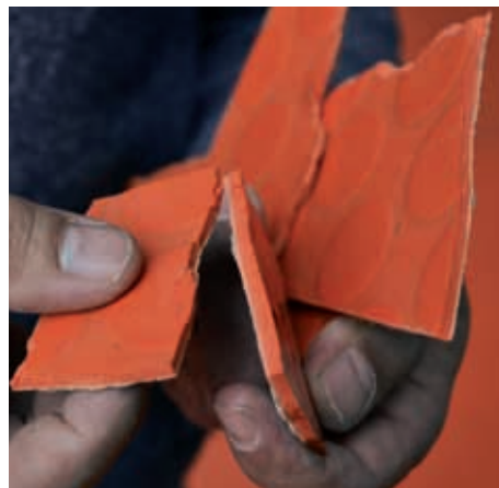
Baustellenbesuch 2: Das Stadttor Düsseldorf ist ein Prestige-Objekt. Hier soll die Empfangsebene erneuert werden. Der alte Nora-Kautschukboden ist in die Jahre gekommen und soll durch einen neuen ersetzt werden. Zehn Bauabschnitte sind hierfür vorgesehen. Das Problem: Der Altbelag lässt sich kaum entfernen. Belag, Klebstoff und Untergrund sind aufgrund von Sonneneinstrahlung eine nahezu unzertrennliche Beziehung eingegangen. Zudem ist der Belag porös und brüchig geworden, was »Stückchen-Arbeit« bei der Abtragung bedeutet.